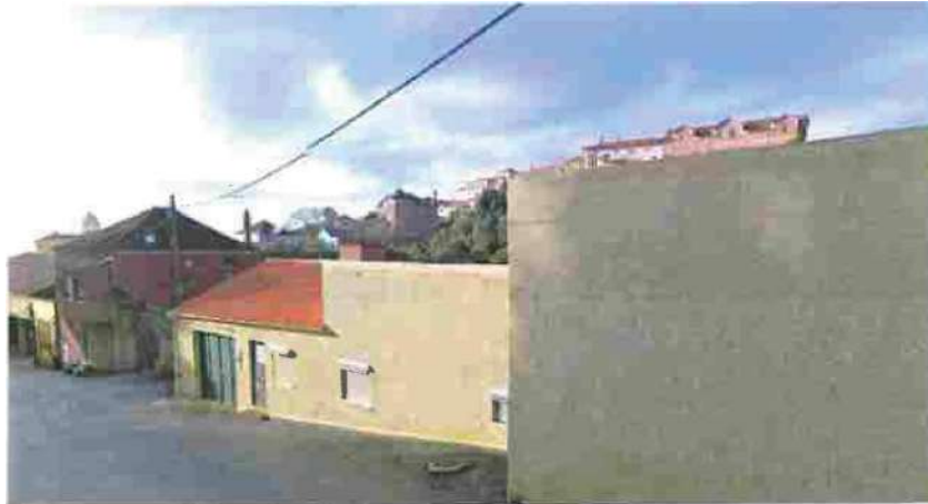
Fig4 - vista alçado do prédio

Pelo exposto é minha opinião que, quer pela localização, importância e pertinência da oportunidade, a aquisição dos referidos prédios assume relevante importância no contexto da reorganização urbanística daquela zona, sendo essenciais para a concretização do planeamento urbanístico, e melhoria das condições de vida da população. A reforçar esta opinião está ainda o fato de ser do conhecimento público que na envolvente está em curso uma ação popular coletiva de, que numa lógica de participação cívica se encontra a mover esforços com vista a construir uma casa mortuária de apoio à capela existente nas imediações. -----