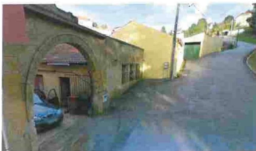
Fig 3 - vista alçado do prédio

O valor acordado foi de 85 000,00€, (oitenta e cinco mil euros) ficando o vendedor de facultar toda a documentação necessária ao agendamento do ato de escritura notarial, após decisão formal da câmara. -----