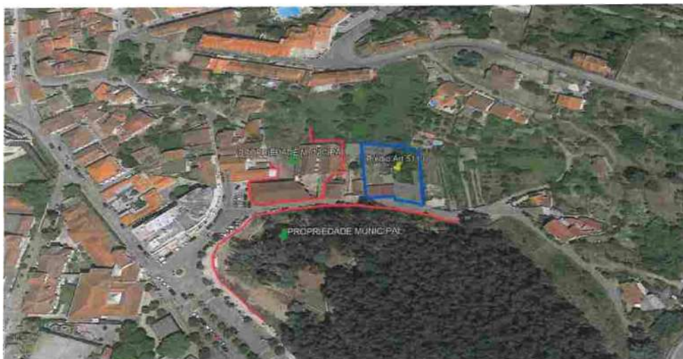
Fig 1 — localização espacial prédio

Mais registro, pelo que é possível verificar dos elementos abaixo e anexos os prédios localizam-se na zona central da Vila com relevante importância para a comunidade local. -----